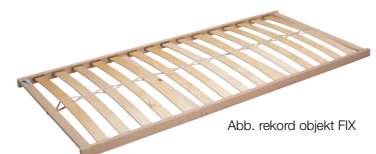
Abb. rekord objekt FIX

Bestens kombinierbar mit Produktlinie rekord objekt